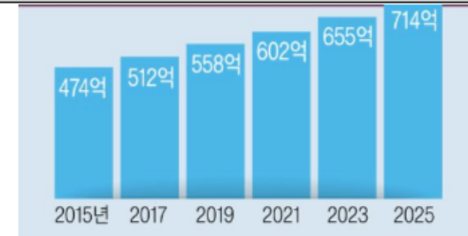
<그림> 글로벌 체외진단기 업체 시장 규모

2) 분자진단 · 현장진료 · 자가진단 검사가 가장 빠른 성장세 IVD 분야중 코로나19 팬데믹의 영향으로 분자진단과 현장진단(POCT)형 테스트에 대한 수요가 가장 큰 폭으로 성장하고 있으며, 분자진단 시장은 2020년 229억 달러에서 2025년 304억 2천만 달러로 성장 할 것으로 예상됨. 특히, 코로나 이슈에 따라 현장진단형 진단(POCT)의 수요가 급격히 늘어나고 있는데, 2020년 약 169억달러에서 2025년에는 2000억 달러 수준으로 증가할 것으로 예상되며, 단순하고 저렴한 현장형 테스트에 대한 수요가 가장 두드러진 성장을 보일 것으로 예상됨.